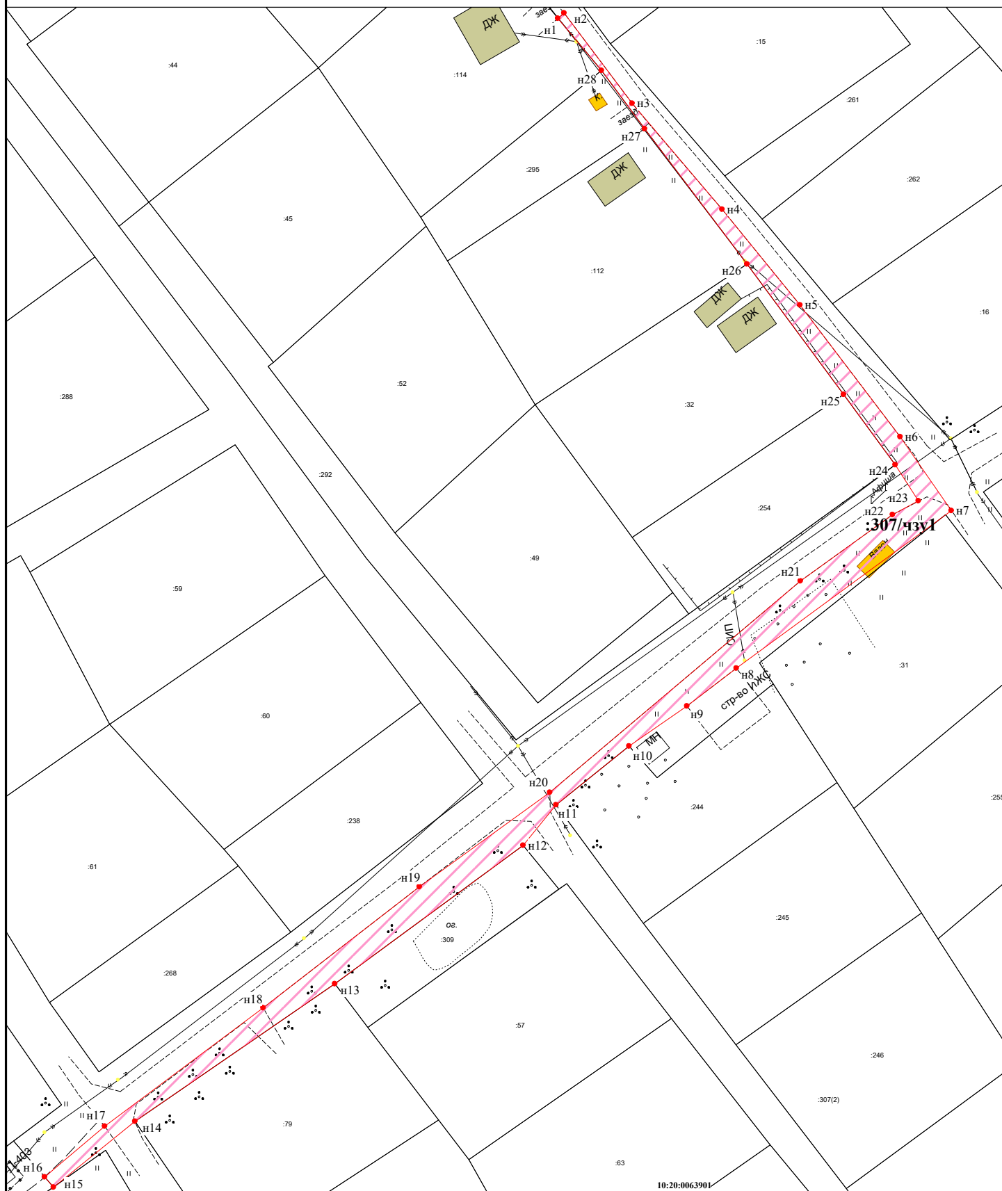
Схема расположения границ сервитута в отношении земель и земельных участков в целях размещения линейного объекта