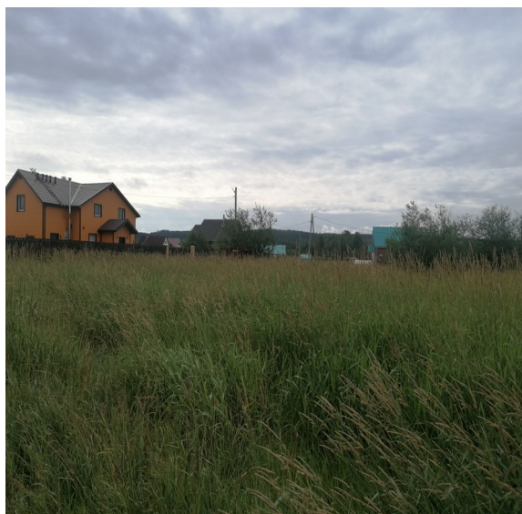
Фото участка по обращению с. Заозерье