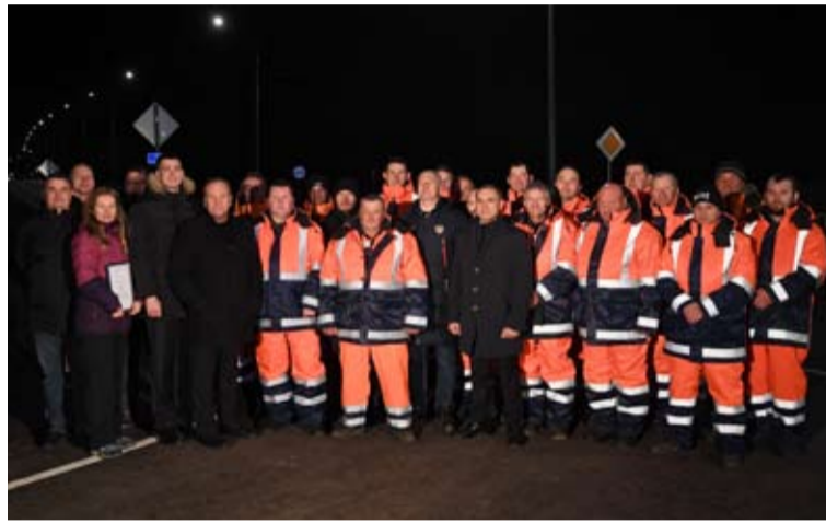
Все они трудились на самых сложных участках. Капитальный ремонт участка трассы А-215 с 58 по 74-й км подрядчик завершил на год раньше предусмотренного контрактом срока (подробнее на стр. 6).

В преддверии Дня работников дорожного хозяйства Артур Парфенчиков вручил сотрудникам компании-подрядчика Благодарственные письма главы Карелии.