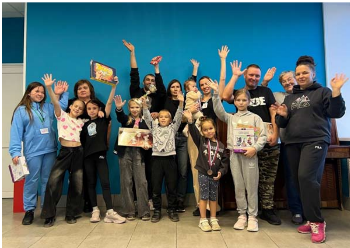
Больше фотографий в официальной группе Прионежского РЦК: vk.com/clubprionegocultura