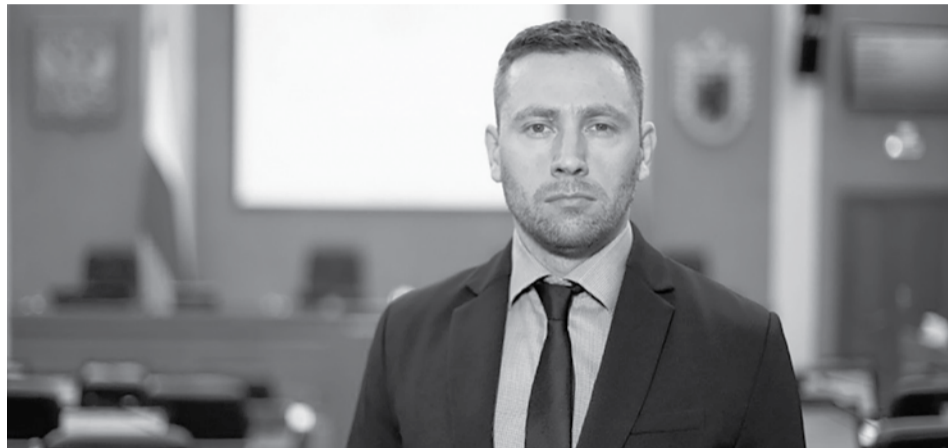
Антон Фокин.

Согласно Конституции Карелии глава региона назначает руководителя органа исполнительной власти, осуществляющего функции в сфере государственного прогнозирования социально-экономического развития, с согласия Законодательного Собрания