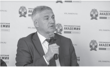
Артур Парфенчиков.

Образовательную часть региональной программы «Герои Карелии» открыли в Петрозаводске