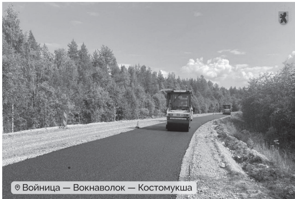
© Войница — Вокнаволок — Костомукша