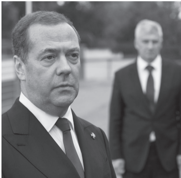
Дмитрий Медведев на госгранице в Карелии.

Зампредседателя Совбеза РФ Дмитрий Медведев считает, что России стоит вернуться к вопросу компенсации за действия финнов в Карелии во время Великой Отечественной войны