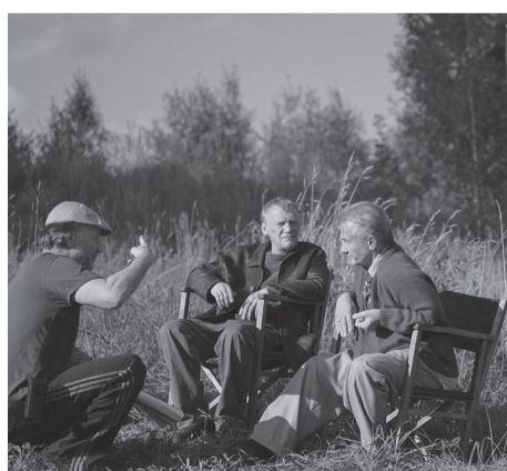
Олег Меньшиков и Алексей Серебряков в Карелии.