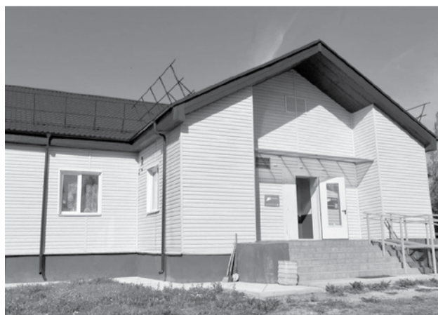
Клуб в поселке Идель

– Главное при решении проблем, особенно на севере, зимой – это оперативность. Когда у тебя десять бюджетов, ты быстро принимаешь решение и приступишь к реализации не сможешь. Вот зимой оперативность нужна при проблемах в коммунальном хозяйстве, но в районах начинаются эти карусели: одни в одном бюджете, другие в другом. И главы поселений не могут