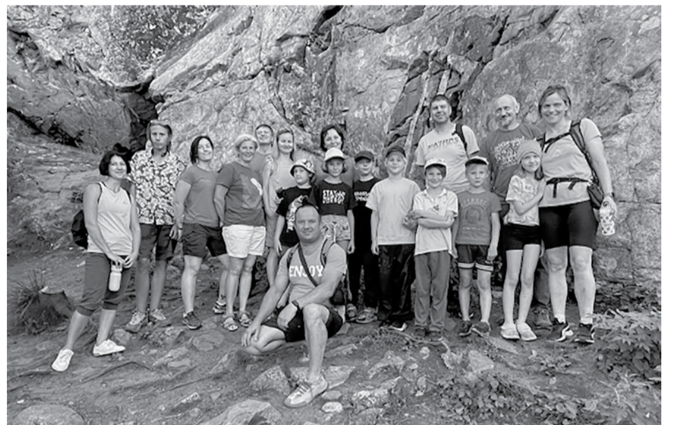
Фото: Ладожские шхеры

Начал работу маршрут «Скальный парк «Змеиная гора» для организованных групп. Посещение маршрута для активного отдыха и скалолазания допускается только в сопровождении аккредитованных гидов-экскурсоводов. Напомним, с 1 января плата за вход в парк увеличилась и теперь составляет 350 руб. с человека.