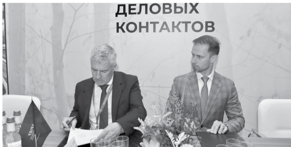
Подписание соглашения между правительством Карелии и компанией «ГЛОНАСС».

По словам Артура Парфенчикова, в 2026 году завершится строительство газопровода-отвода и ГРС Ихала, двух межпоселковых газопроводов, а также распределительных сетей в десяти населенных пунктах Лахденпохского района. Также в 2026 году планируется газифицировать Пудожский район. На 2027 год запланировано завершение строительства газопровода-отвода и ГРС