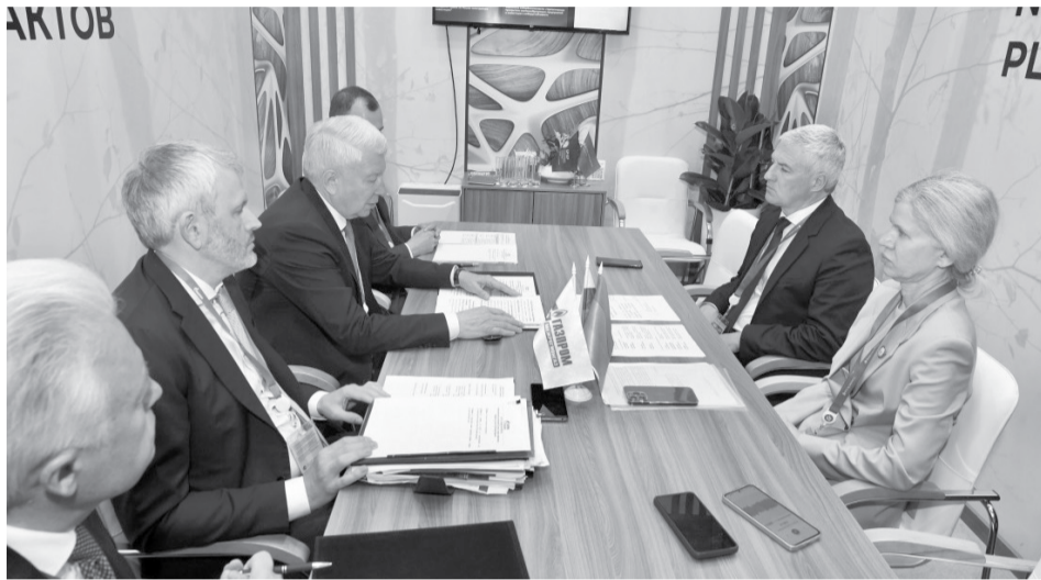
Встреча с представителями ООО «Газпром межрегионгаз».

Делегация из Карелии завершила трехдневную работу на полях Санкт-Петербургского экономического форума (ПМЭФ). Глава региона высоко оценил итоги встреч для республики