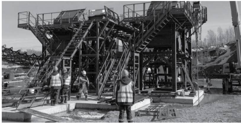
Строительство щебеночного завода.

В планах компании открытие цеха площадью более 2 тыс. кв. метров. Это расширит производственные мощности, а также позволит создать около 20 дополнительных рабочих мест.