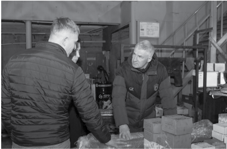
Глава Карелии на предприятии «Сверус».

Строительство завода по производству щебня началось в Кондопожском районе в рамках офсетного контракта с Москвой. «Инвестор, компания по производству щебня «Ситозерский карьер», строит его в рамках офсетного контракта, который Карелия заключила с Москвой. Это первый межрегиональный контракт подобного рода в нашей стране. Мы будем поставлять в столицу щебень, а Москва гарантирует его закупку в течение 10 лет. Причем в очень хороших объемах», – написал Артур Парфенчиков в соцсетях.