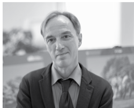
Алексей Хейфец.

Председатель парламентского комитета по здравоохранению и социальной политике Алексей Хейфец прокомментировал отчет главы Карелии Артура Парфенчикова о деятельности правительства республики в прошлом году