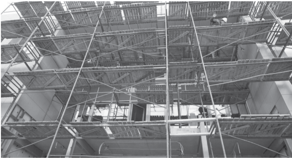
Строительство детского сада в Сортавале