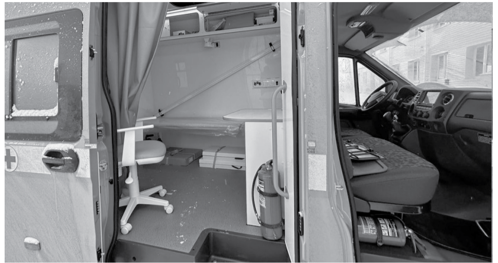
Мобильный ФАП.