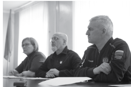
На встрече в рамках проекта #КарелияОткрытая.

Руководитель региона поручил Минобразования и спорта республики проработать проект ФОКа, а местной администрации – найти возможность софинансирования со стороны бизнеса. Карельский Минсельхоз в свою очередь проработает возможность реализации проекта в рамках программы комплексного развития сельских территорий. Параллельно правительство республики рассмотрит и другие варианты финансирования строительства. «Найдем национальные