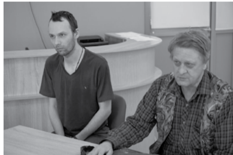
Семья Зверевых.

Военнослужащий выбрал надел, но оформление документов застопорилось на этапе работы местной администрации