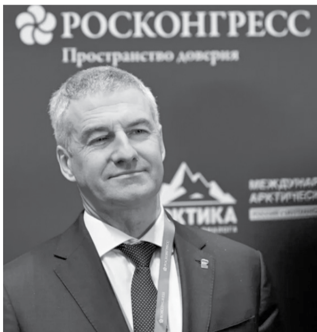
Артур Парфенчиков.

Артур Парфенчиков отметил важную роль агломерации для развития туризма, ведь она находится на маршруте на Соловки.