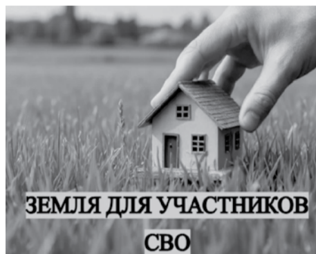
ЗЕМЛЯ ДЛЯ УЧАСТНИКОВ СВО

Минимущества республики разъяснило права на получение земли без торгов для льготной категории граждан