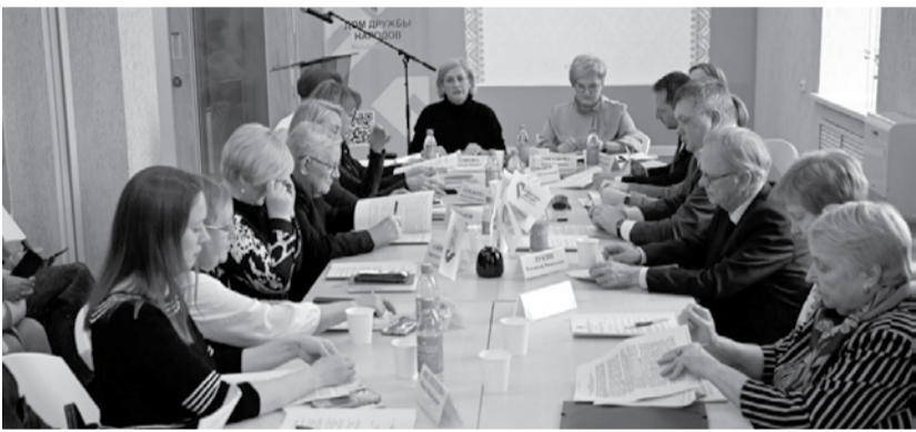
На заседании Совета карелов, вепсов и финнов Карелии.

Сейчас специалисты собирают для сервиса перевода карельский и вепсский языковые корпусы. Работы завершат в 2026 году