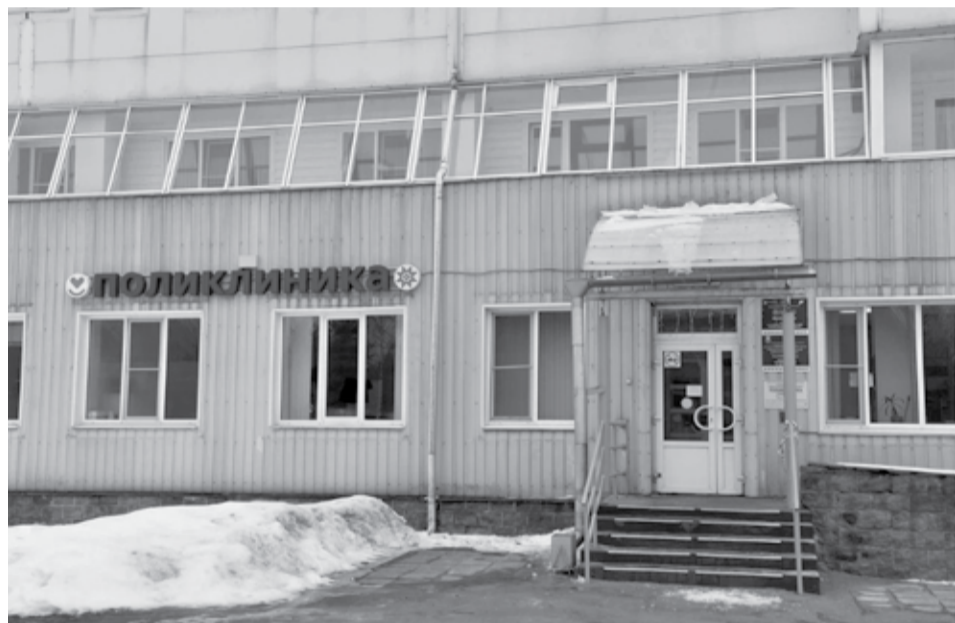
Поликлиника в поселке Пряжа.

Работы проходят по программе модернизации первичного звена здравоохранения президентского нацпроекта «Продолжительная и активная жизнь», а также по региональным программам модернизации здравоохранения республики