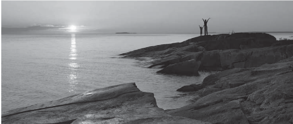
Онежские петроглифы.

Работы пройдут по федеральной целевой программе развития Карелии