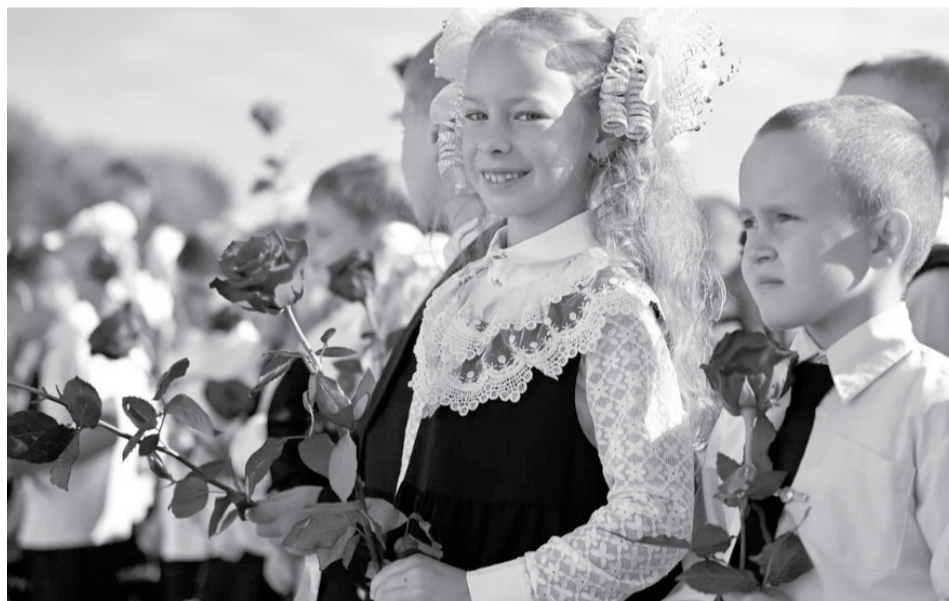
Открытие новой школы в Кеми.

Безработица в Карелии на историческом минимуме, менее 0,6%. С начала 2024 года служба занятости трудоустроила более 5 тыс. человек. При этом в условиях подъема экономики острой проблемой остается нехватка квалифицированных кадров на предприятиях. На решение проблемы направлен новый нацпроект «Кадры»: это развитие трудоустройства выпускников и переобучения уже работающих граждан.