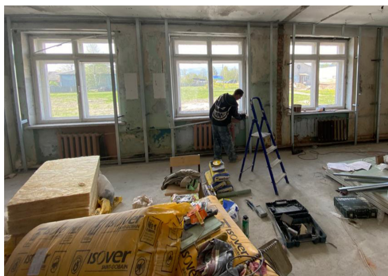
В ходе ремонта в п. Деревянном

годно направляются на укрепление материально-технической базы и проведение текущих ремонтов муниципальных домов культуры. Субсидии в объеме 18 млн рублей также выделяются для населенных пунктов с числом жителей до 50 тыс. человек.