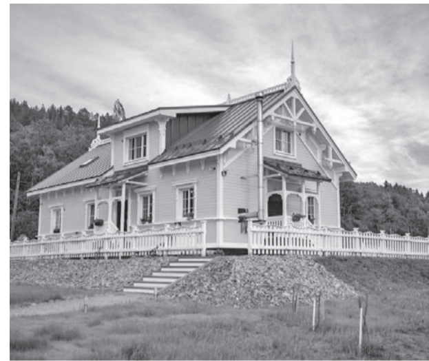
Магазин-кафе «Северный модерн».

– Мы живем в эпоху цифровизации, основной клиент находится в Сети. В интернет-магазине можно приобрести любую