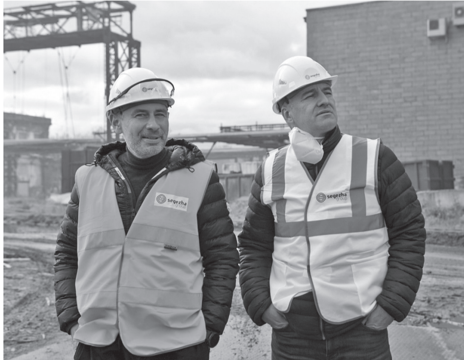
Михаил Шамолин и Артур Парфенчиков.

Глава региона Артур Парфенчиков обсудил развитие города с президентом Segezha Group Михаилом Шамолиным.