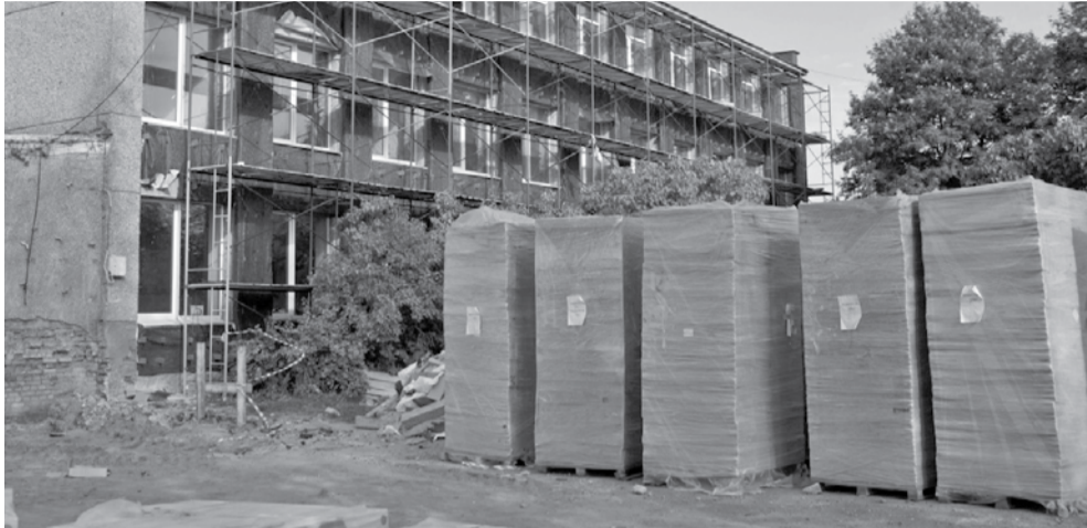
Ремонт школы в Шуе.

Все это время детей будут возить на учебу в соседний поселок Мелиоративный