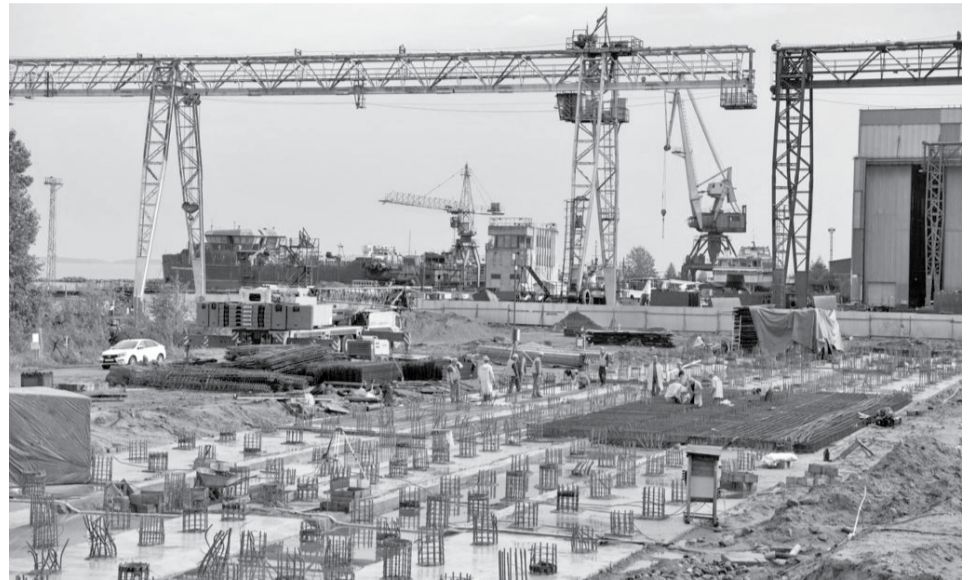
Модернизация на Онежском судостроительно-судоремонтном заводе.