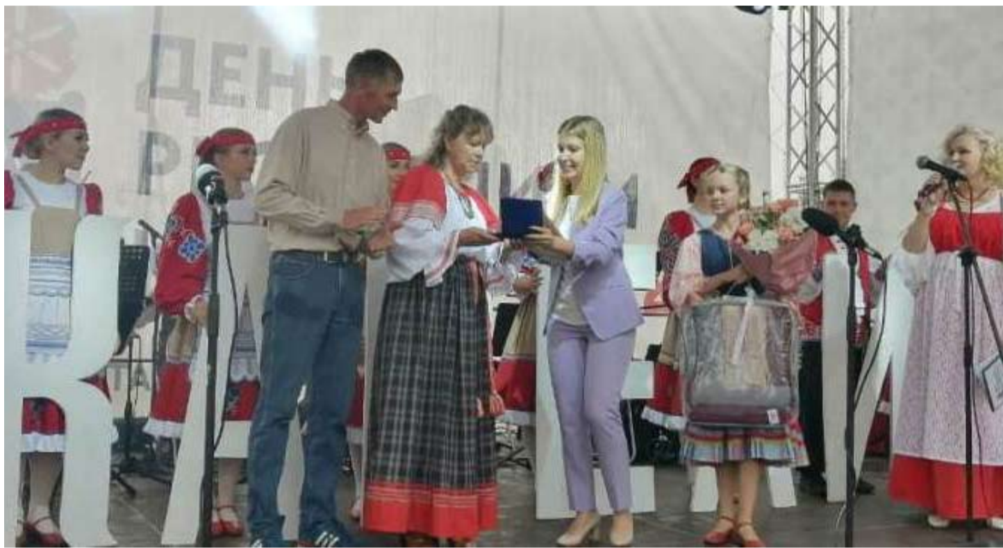
Вручение медали в селе Шелтозеро