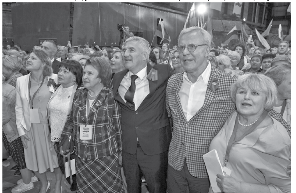
Финальный момент форума – совместное исполнение новой песни про Карелию.

А в финале форума прозвучала новая песня о Карелии – ее представили известные карельские артисты. По мнению многих участников форума, в ряду замечательных песен о нашей республике появился новый хит. «Карелия! Тут место нашей силы и доверия!» Эти слова объединили самых разных людей – тех, кто готов и дальше работать ради развития республики.