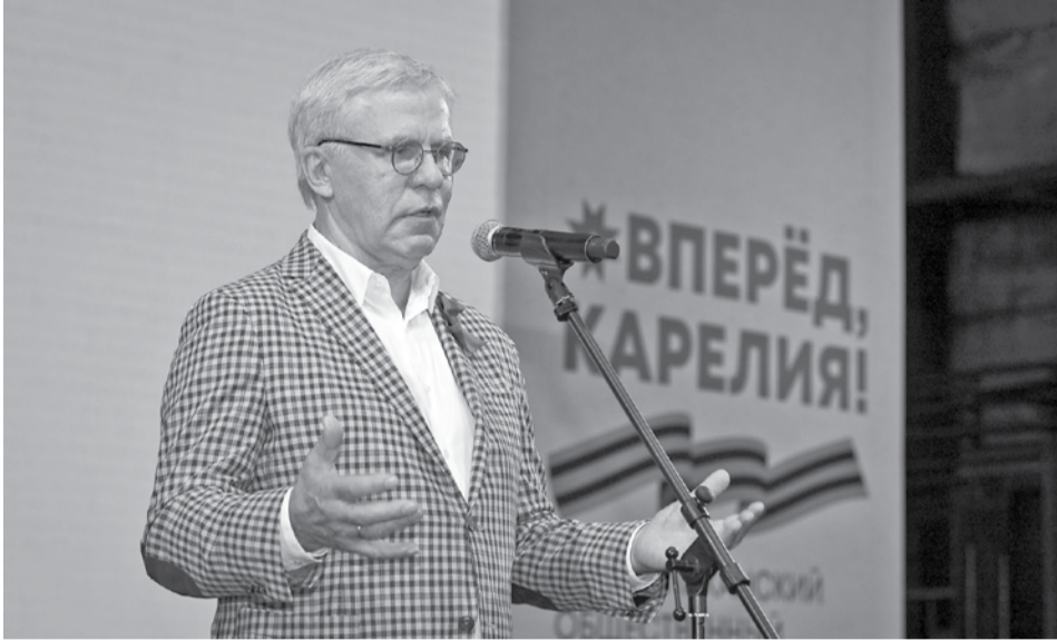
Вячеслав Фетисов: «Главное сейчас – это сплоченность и объединение всех жителей республики».