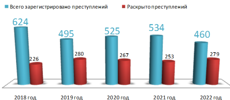
Состояние преступности в Прионежском муниципальном районе за 12 месяцев (динамика)

Вместе с тем, на 14,6% снизилось число тяжких и особо тяжких преступлений (со 123 до 105). Данное снижение обусловлено снижением числа зарегистрированных квалифицированных краж, предусмотренных ч.3, ч.4 ст. 158 УК РФ (с 42 до 21, -21), незаконных порубок, предусмотренных ч.3 ст. 260 УК РФ (с 6 до 0, -6), фактов причинения тяжкого вреда здоровью (с 8 до 4, -4), фактов фальшивомонетничества (с 3 до 0, -3).