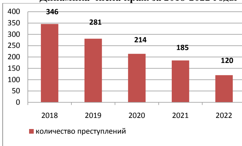
Динамика числа краж за 2018-2022 годы

Из представленной диаграммы видно, что в 2018 году наблюдалось максимальное число краж, но в результате планомерной профилактической работы, а также ряда криминологических факторов, в 2022 году зарегистрировано минимальное число краж за последние 5 лет (120).