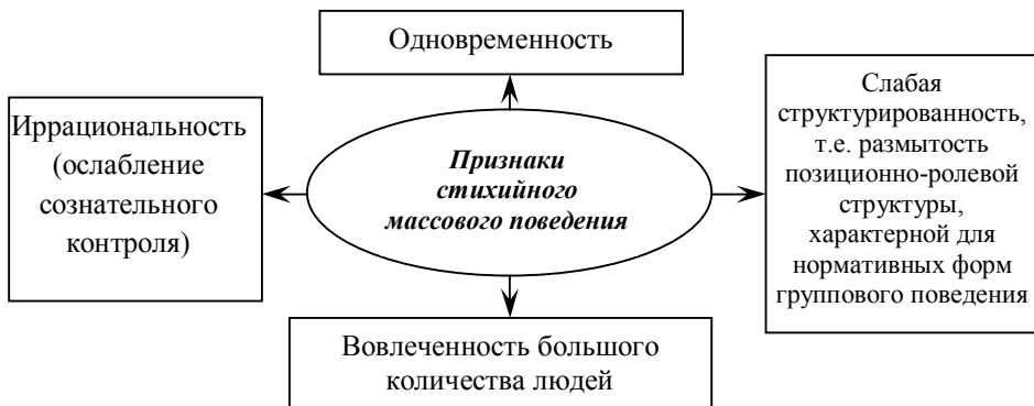
Рисунок 1 – Признаки стихийного массового поведения

Для стихийного поведения характерно преобладание иррациональных, инстинктивных чувств над осознанными и прагматическими.