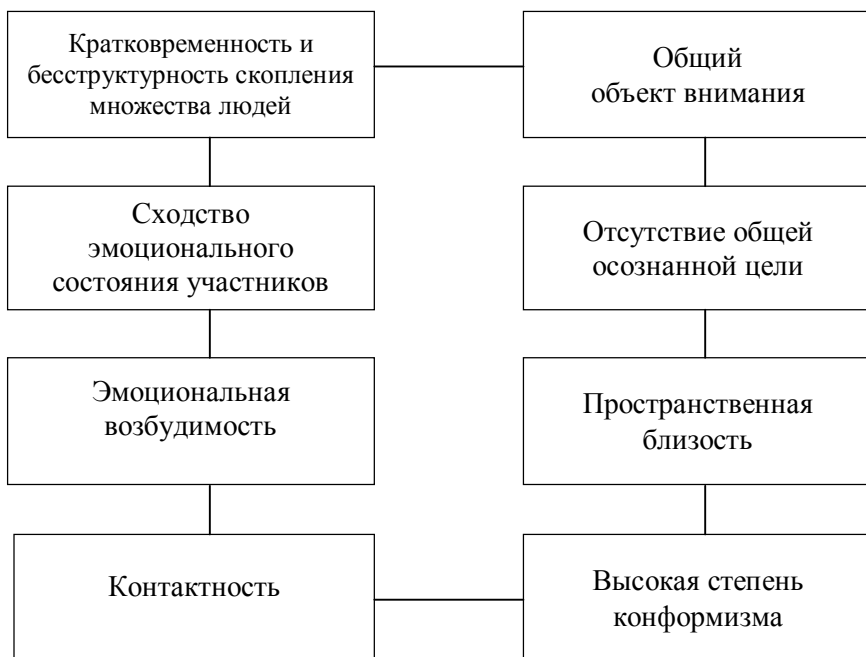
Рисунок 2 – Психологические свойства толпы