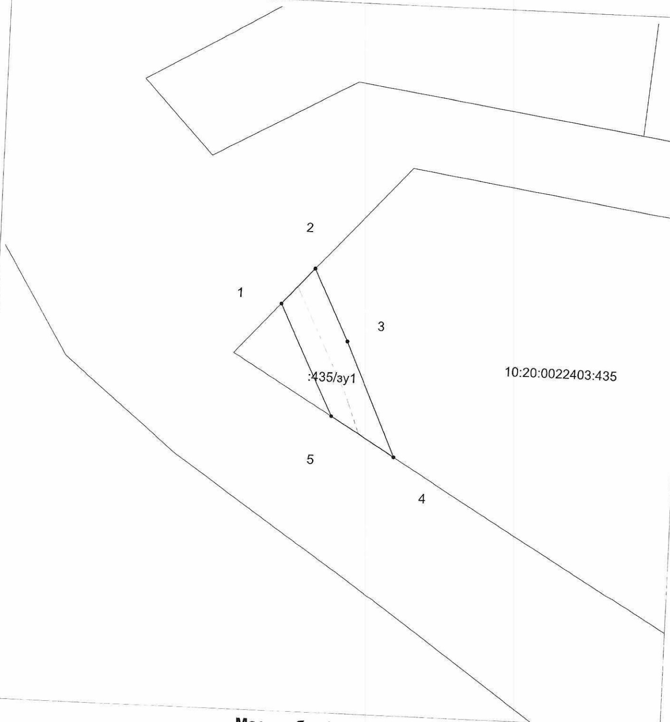
Схема границ сервитута на кадастровом плане территории