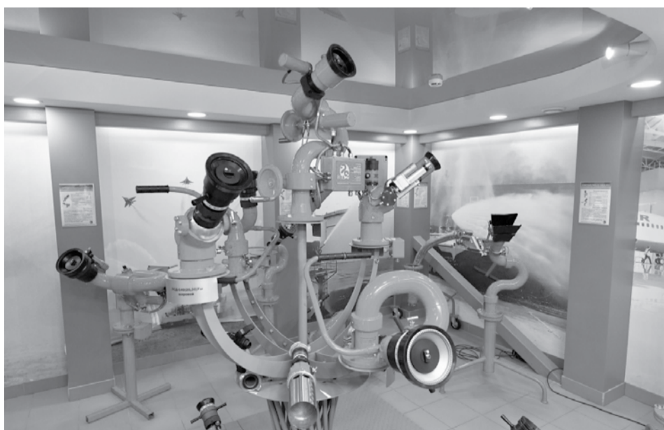
Предприятие «ЭФЭР».

Плотность роботизации в России составляет 25 роботов на 10 тыс. сотрудников, этот показатель хотят увеличить почти в 6 раз к 2030 году