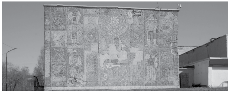
Фото: «Сохраним панно «Калевала» в городе Питкяранте»