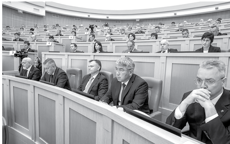
Парламентские слушания.