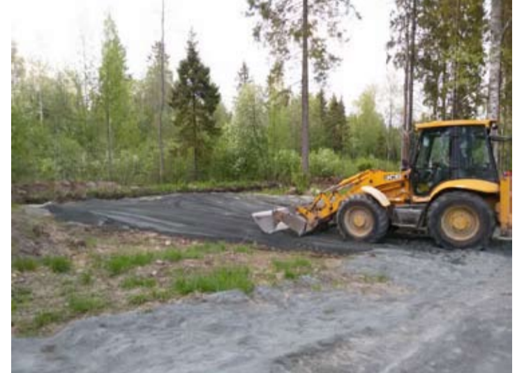
Фото: строительство «Тропы здоровья»

■ В Прионежском районе реализуют проекты, отобранные через Программу поддержки местных инициатив (ППМИ) и Территориальное общественное самоуправление (ТОС). Об этом сообщили на официальной странице Прионежского района.