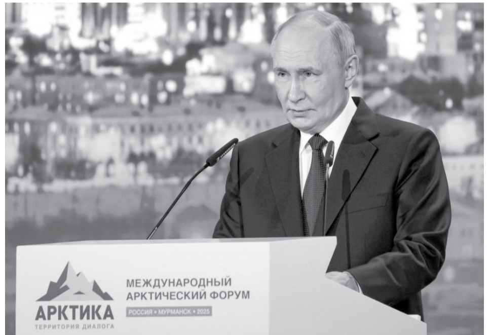
Скриншот трансляции форума в Мурманске

«Арктику ежегодно посещает более миллиона туристов, чтобы познакомиться с ее ландшафтами, увидеть северное сияние, заняться арктической рыбалкой, покататься на собачьих упряжках, в конце концов. Число туристов растет, соответственно, появляются новые проекты в этой сфере, такие как центр арктического туризма с горнолыжным направлением в Ямало-Ненецком автономном округе или аквапарк курорт и всепогодный гостиничный комплекс в Карелии», – ранее отметил Путин.