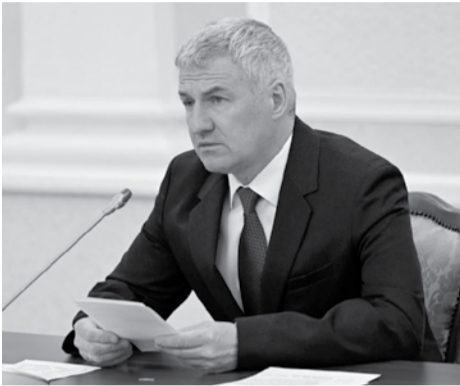
Артур Парфенчиков.

Об этом сообщил глава республики Артур Парфенчиков во время прямой линии