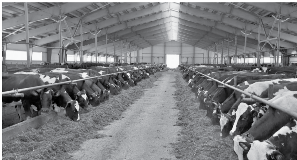
Племсовхоз «Ильинский».

Создание станций с 2026-го по 2030 год предусмотрено при строительстве магистрального газопровода «Волхов – Мурманск» и газопровода «Волхов – Сегежа – Костомукша», проходящих через Карелию