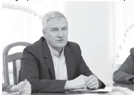
Артур Парфенчиков.

На смену электронному дневнику «Барс» в новом учебном году придет «Московская электронная школа»