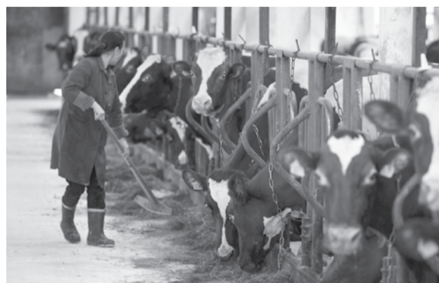
Племсовхоз «Мегрега».

В республике продолжают внедрять передовые технологии в сельское хозяйство