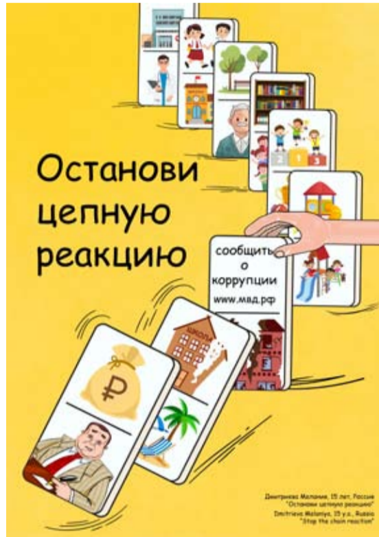
Иллюстрация: плакат участницы конкурса М. Дмитриевой

К участию приглашаются молодые люди в возрасте от 10 до 17 и от 18 до 25 лет. Конкурс проходит в трех номинациях: лучший плакат, лучший рисунок и лучший видеоролик. Подать заявку можно на сайте: anticorruption.life до 1 октября, итоги конкурса подведут 9 декабря, когда в мире отмечают День борьбы с коррупцией.