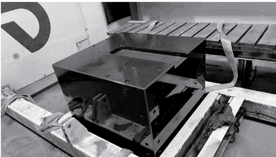
Деталь для коллайдера.

Карельская гранитная компания добывает камень в Лоухском районе