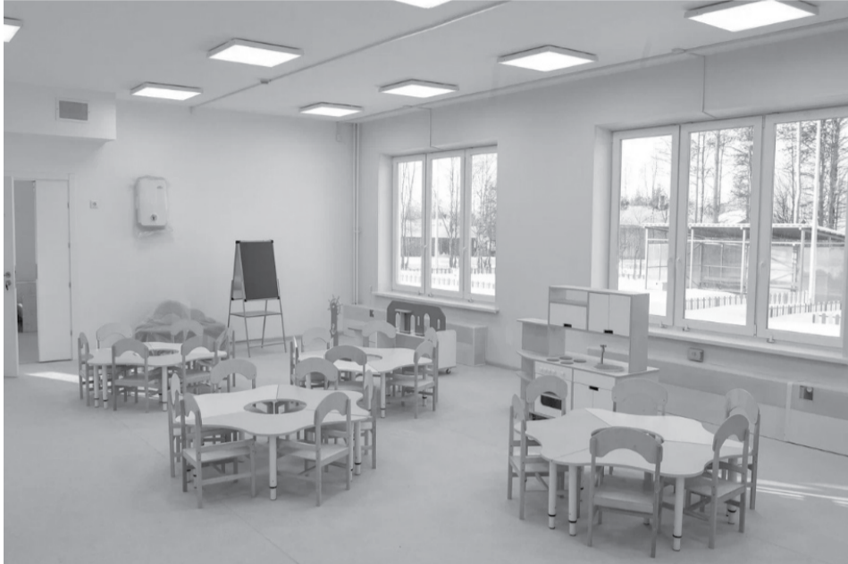
Детский сад в поселке Калевала.

Это первый реализованный социальный проект по госпрограмме развития Арктики