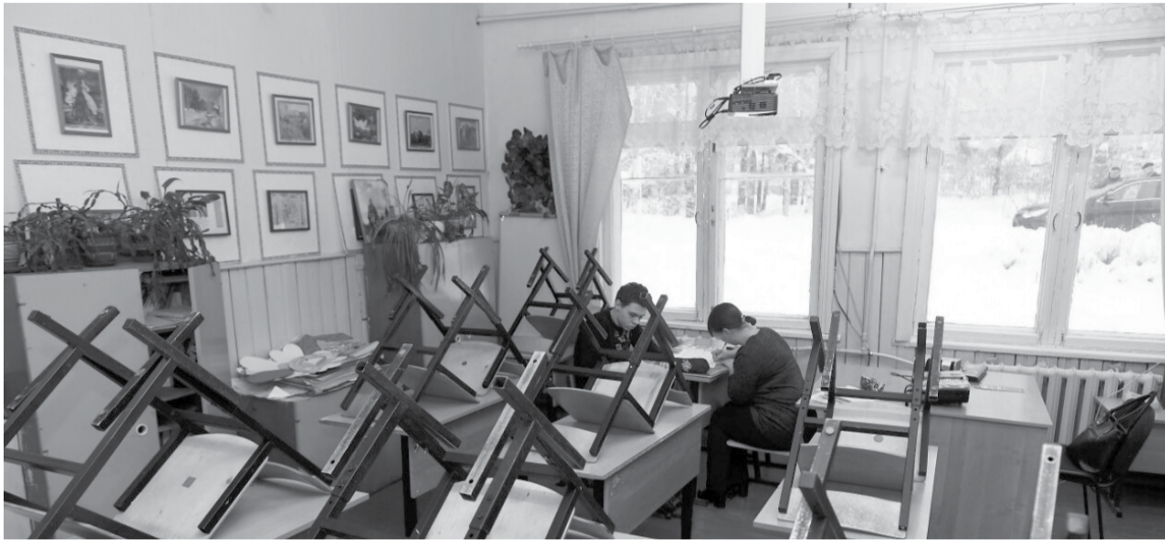
Школа в поселке Деревянка.

Зарегистрироваться на участие в конкурсном отборе можно до 15 апреля.