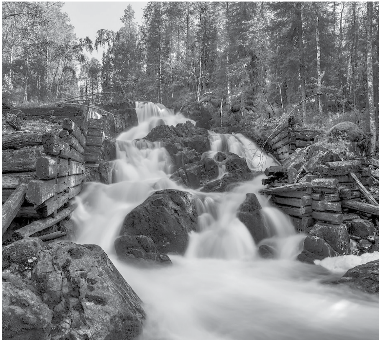
Водопад Селььякоски. Национальный парк «Паанаярви».

В Карелии более сотни водопадов, по крайней мере столько обнаружили ученые. Примерно половина из них находится в Северном Приладожье. В их числе Ахинкоски и Юканкоски, которые по высоте и популярности конкурируют с легендарным Кивачом. О водопадах сегодняшних и утраченных – в новом выпуске проекта «100 символов Карелии».