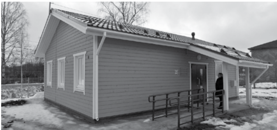
Фельдшерско-акушерский пункт в Спасской Губе.

Фельдшерско-акушерский пункт в Спасской Губе начнет работать в конце января, сейчас он проходит лицензирование.