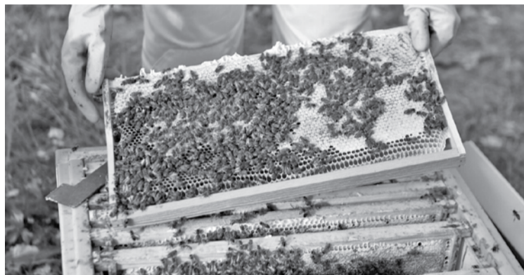
Пчелы породы бакфаст.

На этой же встрече о первых результатах сотрудничества с Ираном рассказал вице-премьер по вопросам экономики Дмитрий Родионов. По его словам, на прошлой неделе дебютная партия пиломатериалов из Карелии отправилась в эту арабскую республику. Впереди еще много направлений для взаимовыгодного сотрудничества, считает вице-премьер.