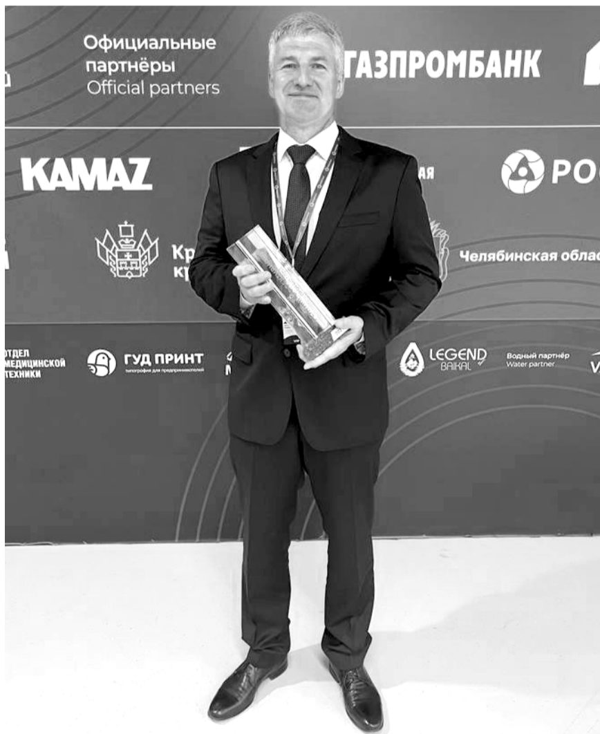
Артур Парфенчиков с кубком «Прорыв года».

Регион поднялся сразу на 20 строчек в рейтинге эффективности развития промышленности – теперь мы на 17-м месте в стране